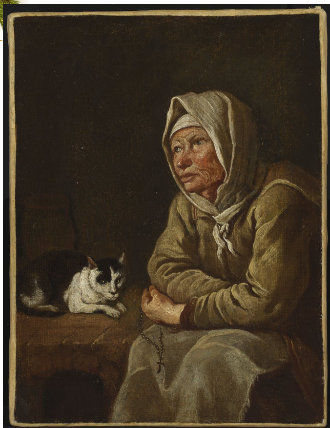
Bătrână cu pisica, pictură de Johann Lucas Kracker