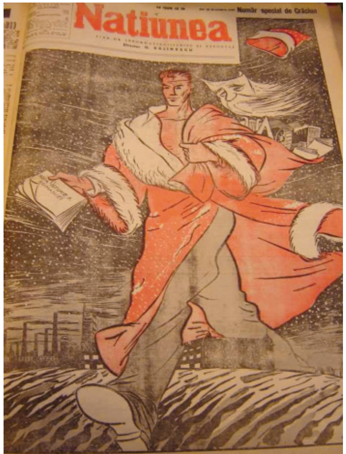
Moș Gerilă, proletarul, își leapădă barba de Moș Crăciun (Ziarul Națiunea 20 dec. 1848)

Comuniștii, după marea revoluție din octombrie, care a avut loc în noiembrie, au încercat o