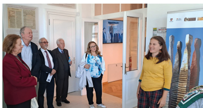
În vizită la Casa Colecțiilor