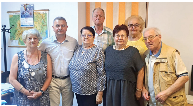
Consiliul Director și Comisia de Cenzori