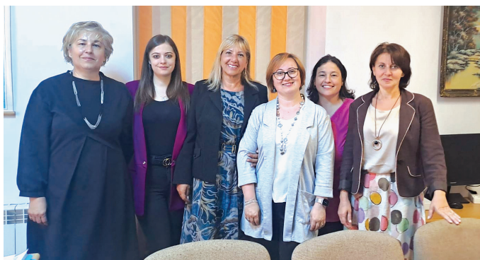
Personalul Asociației C.A.R.P. Bistrița

Îmbinarea armonioasă a celor două componente, de acordare a împrumuturilor cu acordarea de ajutoare nerambursabile și participarea la activități social-culturale, creează din C.A.R.P.-uri o entitate aparte, față de unitățile bancare sau instituțiile financiare nebancale, deoarece asigură și realizează un anumit gen de protecție socială a membrilor, în comunitățile din care provin, pentru că în lipsa acestora pensionarii și persoanele în vârstă s-ar afla, de cele mai multe ori, în imposibilitatea de a obține de altundeva un împrumut, resursele financiare necesare prin care să-și rezolve frecvent anumite nevoi existențiale.