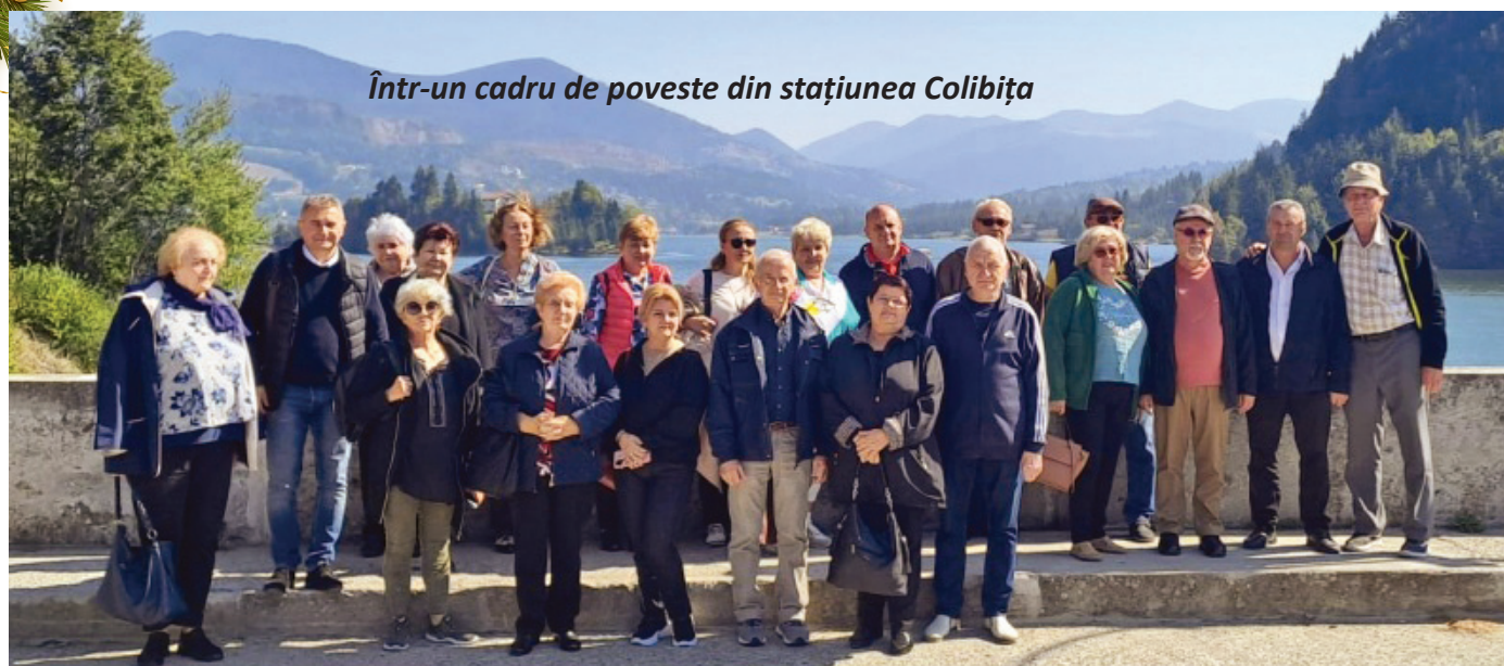
Într-un cadru de poveste din stațiunea Colibița