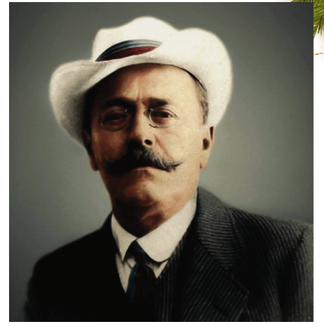
ION LUCA CARAGIALE (Momente și schițe)

Dacă există cineva care a deslușit până în auricule și ventricule, până în taina sa cea mai ascunsă firea românului, metehnele, calitățile și defectele sale, pornirile cele mai aprinse și mitocăniile cele mai rudimentare, acela a fost, este și va fi atâta vreme cât va exista acest popor, Ion Luca Caragiale. (Redacția)