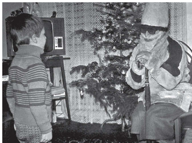
Moș Gerilă, cu cojocul de alain delon, așa cum l-am pomenit în anii '70 - '80

Regimurile comuniste au încercat să-l introducă în tradițiile locale pe Moș Gerilă ca personaj de rezervă al celorlalți doi moși, în încercarea lor de a înlătura rolul religiei din tradiții. Nu prea le-a reușit, deoarece oamenii mergeau în continuare la biserică, împărțeau merinde pentru cei răposați, se rugau la icoane, așa cum o făceau, de altfel, mai pe ascuns ce-i drept, și cei din clasa conducătoare, cu icoanele ascunse pe șifonier. Moș Gerilă a fost lăsat la vatră imediat după 1989, și, imediat până să-l redescoperim pe al nostru moș aducător de cadouri și bucurii, a venit altul. Pe acesta l-am adoptat și ni l-am