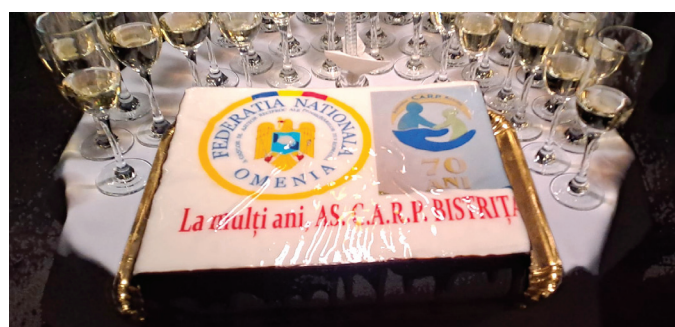
De la un moment festiv nu putea să lipsească tortul aniversar