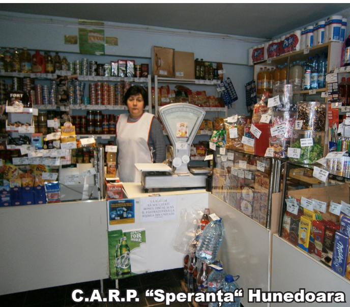
C.A.R.P. "Speranța" Hunedoara