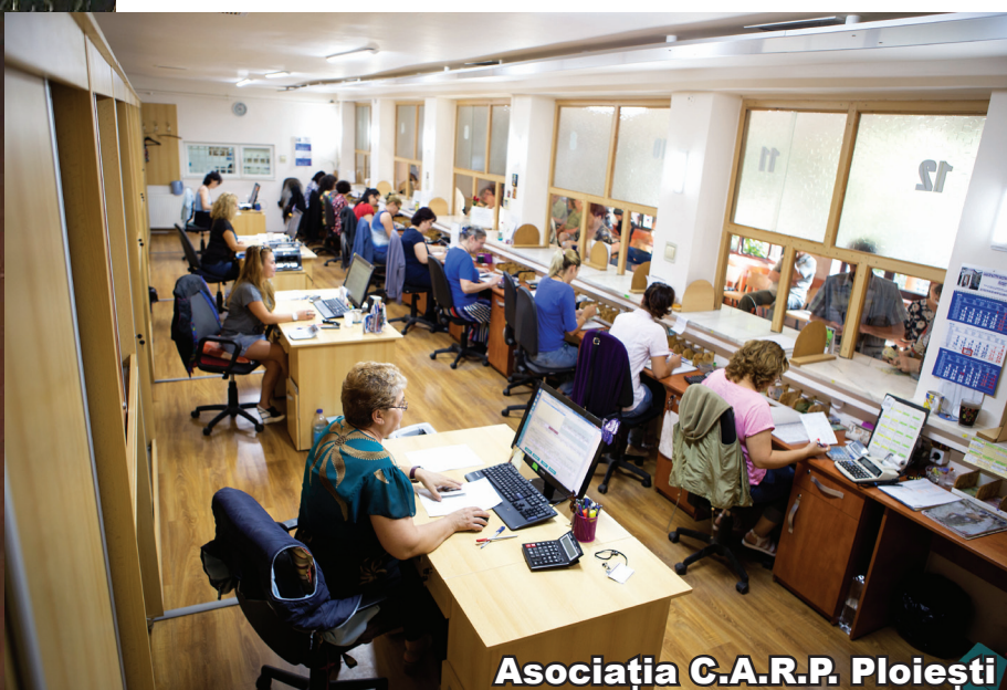
Asociația C.A.R.P. Ploiești