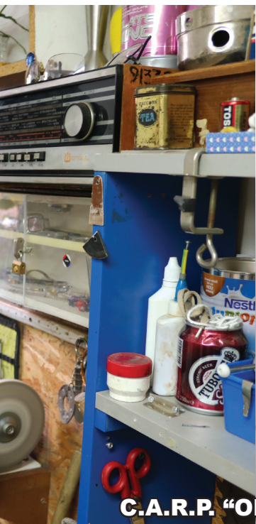
C.A.R.P. "OMENIA" București