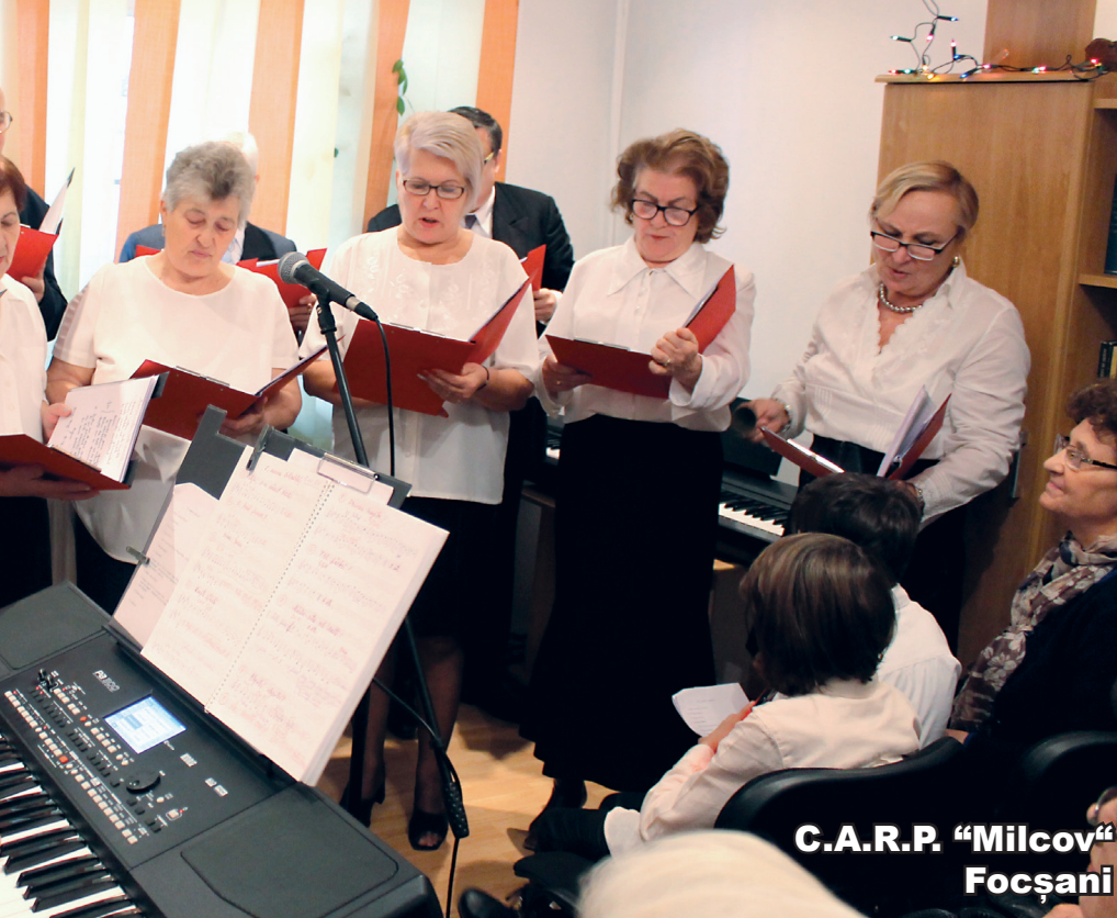
C.A.R.P. "Milcov" Focșani