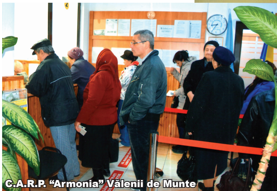
C.A.R.P. "Armonia" Valenii de Munte