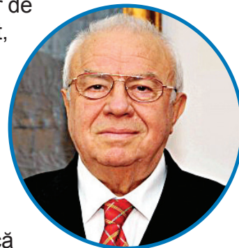
ALEXANDRU ARȘINEL, actor, Director Adjunct al teatrului Constantin Tănase

Unul din obiectivele majore ale Federației Naționale “OMENIA” a Caselor de Ajutor Reciproc ale Pensionarilor din România este și acest deziderat, îmbătrânirea activă. Pensionarii trebuie să realizeze ce forță umană reprezintă, dacă s-ar organiza și și-ar impune punctele de vedere. Persoanele vârstnice trebuie să-și aleagă în frunte oameni care să se bată cu adevărat pentru ei, nu să mimeze că se luptă pentru pensionari. Ei reprezintă o forță formidabilă. Știți ce înseamnă un million de pensionari din cei cinci milioane câți suntem? N-ar crâcni unul în fața noastră, a pensionarilor. Să nu se resemneze! Știți câte s-ar putea face pentru ei, câte case de odihnă, sanatorii, etc.? I-am obliga pe guvernanți, pentru că reprezentăm o forță votantă și determinantă. Asta ar trebui să facă, să lupte. Să lăsăm Cișmigiul, sau dacă ne adunăm în Cișmigiu, să ne punem la punct niște planuri de atac în care nu cerem mult, dar cerem să trăim civilizată și demn. De ce nu ies eu la pensie și mulți ca mine muncesc: pentru că au copii, au nepoți, care nu au din ce să trăiască, nu au casă, nu au serviciu. Pensionari, nu vă lăsați cumpărați!