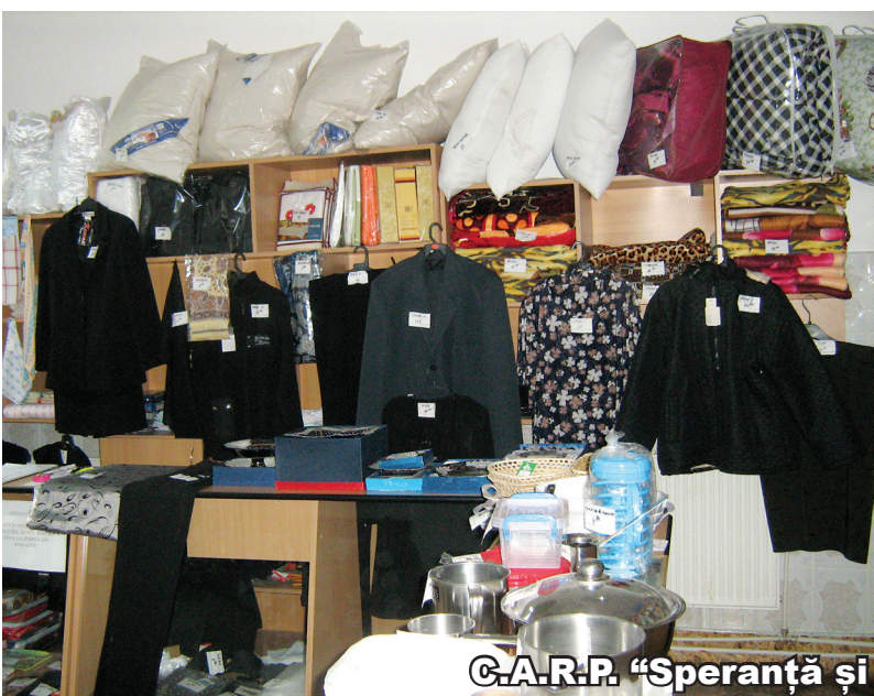
C.A.R.P. "Speranța și OMENIE" Moinești