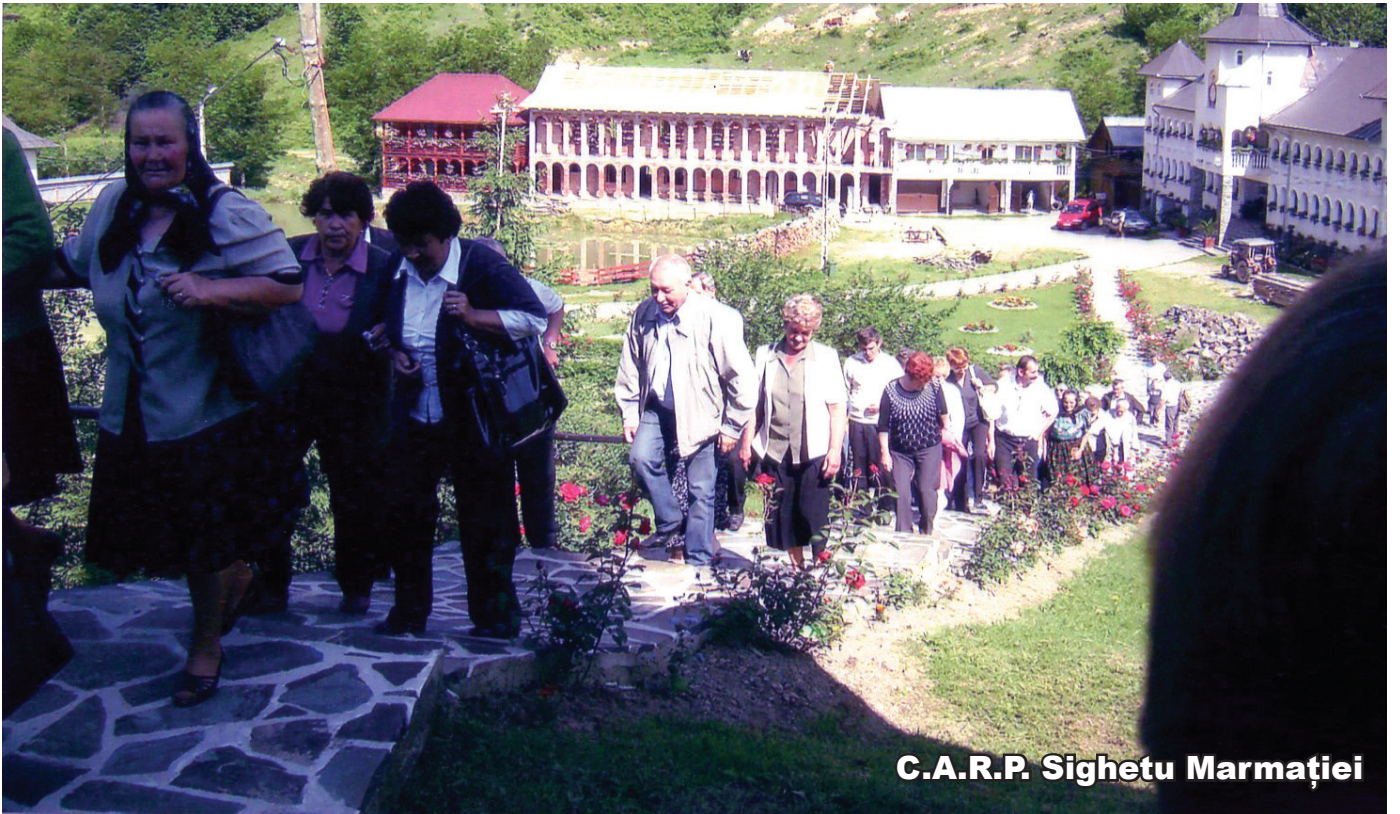
C.A.R.P. Sighetu Marmăției