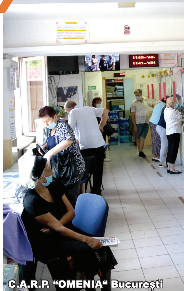
C.A.R.P. "OMENIA" București

Sistemul de ajutor reciproc dezvoltat în zeci de ani de funcționare pornește în primul rând de la o bună înțelegere a nevoilor seniorilor de servicii financiare adaptate și ușor de accesat, completat de o altă componentă importantă, aceea de consiliere și educație financiară. Veniturile mici sau lipsa acestora, vârsta înaintată, refuzul instituțiilor financiare de a acorda servicii bancare, educația precară și abilitățile fizice în declin reprezintă bariere în accesarea de servicii financiare pentru seniori. Astfel, casele de ajutor reciproc ale pensionarilor promovează incluziunea financiară a unui segment de populație nebankabil prin informare/educație pentru reducerea riscului de abuz financiar și pentru creșterea calității vieții seniorilor din România.