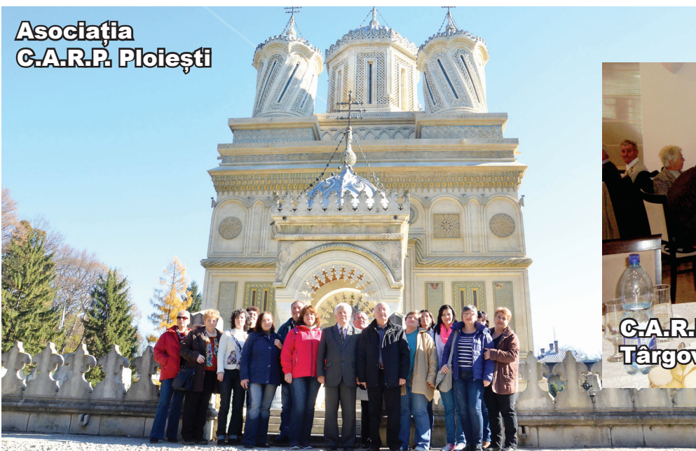
Asociația C.A.R.P. Ploiești