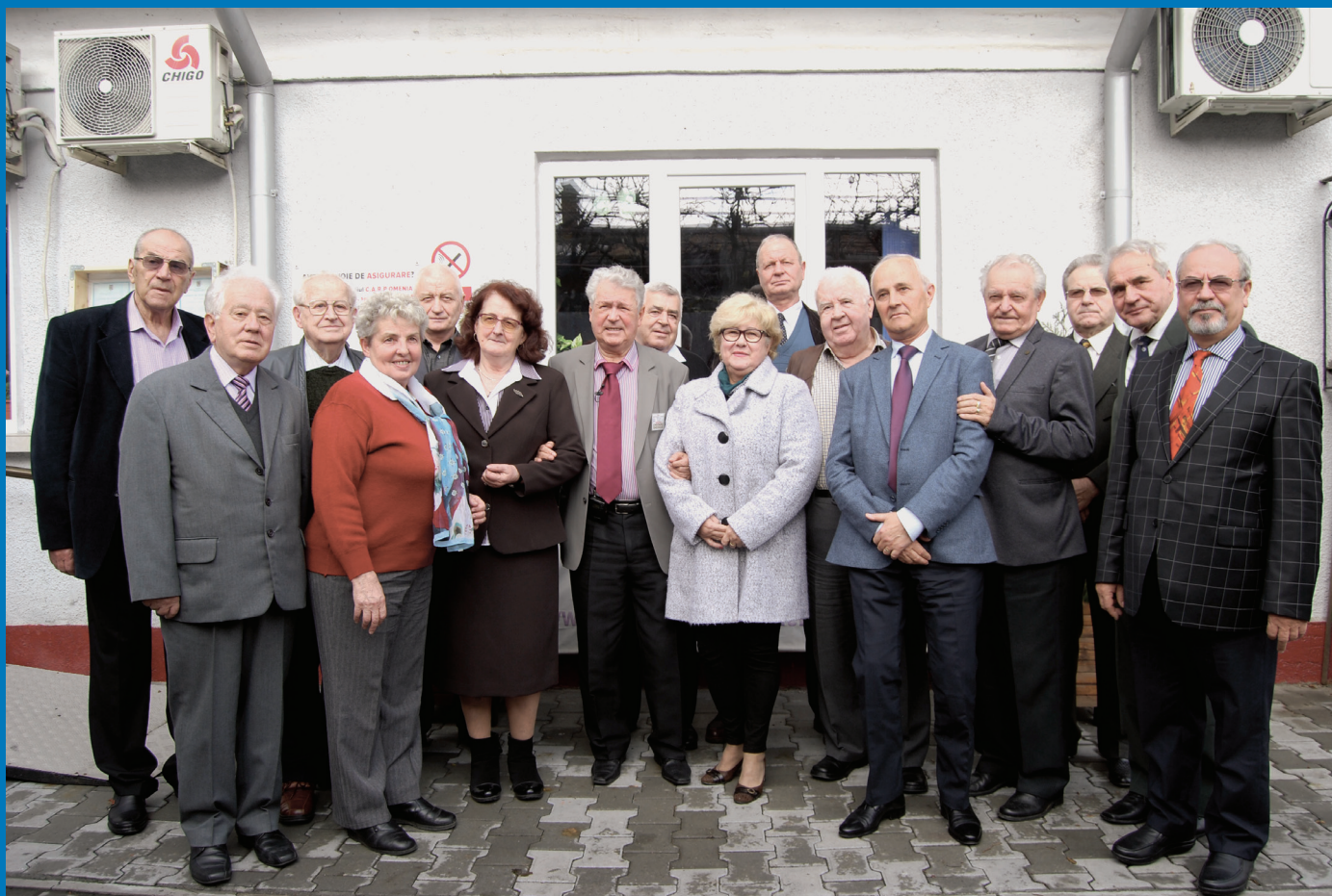
Membrii Comitetului Director

F ederația Națională “OMENIA” a Caselor de Ajutor Reciproc ale Pensionarilor din România este o organizație nonguvernamentală, apolitică, având ca scop perfecționarea activităților desfășurate de către casele de ajutor reciproc ale pensionarilor membre, pentru întrajutorarea și protecția socială a membrilor individuali, persoane vârstnice.