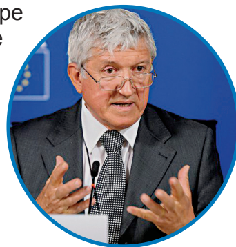
MIRCEA DIACONU actor

D espre vârsta a treia, cred că fiecare poate alege dacă și-o petrece pe bancă în parc, sau rămânând activ, așa cum a făcut mama mea, care avea grădina plină la 89 de ani și care producea cu mânuțele ei, cele necesare vieții. Formula miracol s-ar putea exprima cam așa: activitate și pasiuni care îți dau satisfacție la orice vârstă. În România sunt nenumărate situații în care putem vorbi de incluziune și protecție socială pentru vârstnici, dar sunt și situații în care lucrurile nu stau deloc așa. Diferența pe care o văd eu, cel puțin față de vestul Europei, este că în mentalitatea românească familia este văzută ca o entitate care trebuie să funcționeze ca atare până la capăt. Nu ne aruncăm părinții și bunicii la azil. La noi, oamenii de vârsta a treia vor să arate că încă pot să își crească și să își mângâie nepoții. Cred că aspectul acesta contează enorm, poate mai mult chiar decât confortul financiar, care este, bineînțeles, important, dar care nu duce neapărat la incluziune socială. Nu e doar de dorit, ci și firesc, să ne trăim bătrânețile acasă, înconjurați de nepoți, ceea ce este de fapt un mod de viață mai puțin întâlnit în Occident.