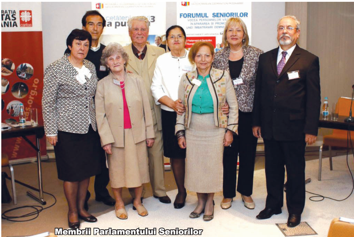
Membrii Parlamentului Seniorilor