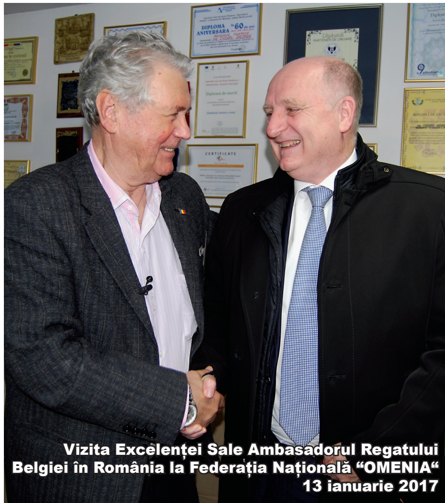
Vizita Excelenței Sale Ambasadorul Regatului Belgiei în România la Federația Națională "OMENIA" 13 ianuarie 2017