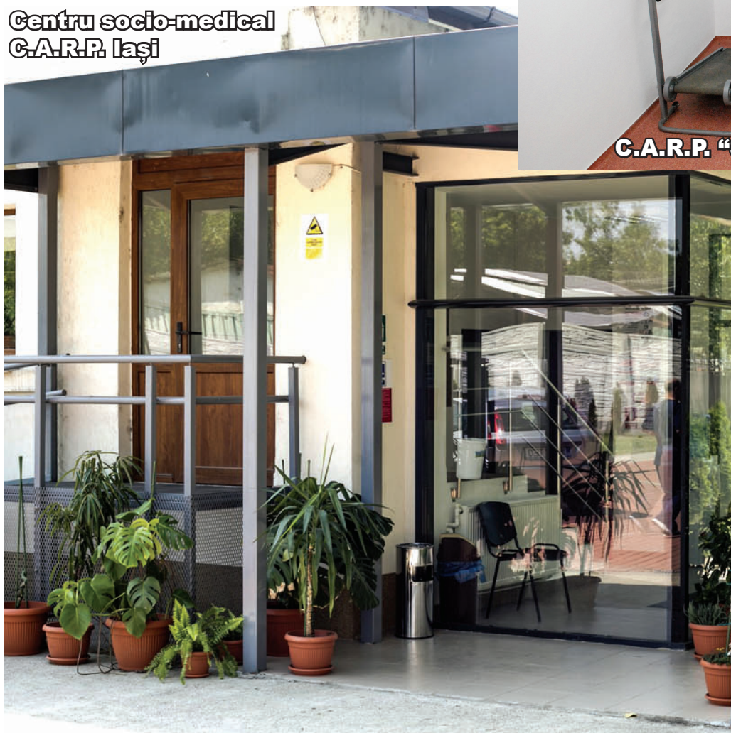
Centru socio-medical C.A.R.P. Iași

O bună stare de sănătate, dar și posibilitatea de a accesa servicii medicale reprezintă unul dintre cei mai importanți indicatori ai calității vieții, de aceea, casele de ajutor reciproc ale pensionarilor asigură accesul persoanelor vârstnice la servicii medicale și sociale oferite atât prin cabinetele proprii, cât și în colaborare cu diverse instituții medicale, publice sau private. La nivel național sunt oferite servicii de medicină de familie, geriatrie-gerontologie, oftalmologie, cardiologie, stomatologie, kinezoterapie, audiometrie, psihoterapie, ortopedie, recoltare analize. Periodic sunt organizate campanii de tip caravană socio-medicală pentru seniorii din comunitățile din mediul rural, iar unele C.A.R.P.-uri oferă servicii de îngrijire la domiciliul persoanelor vârstnice.