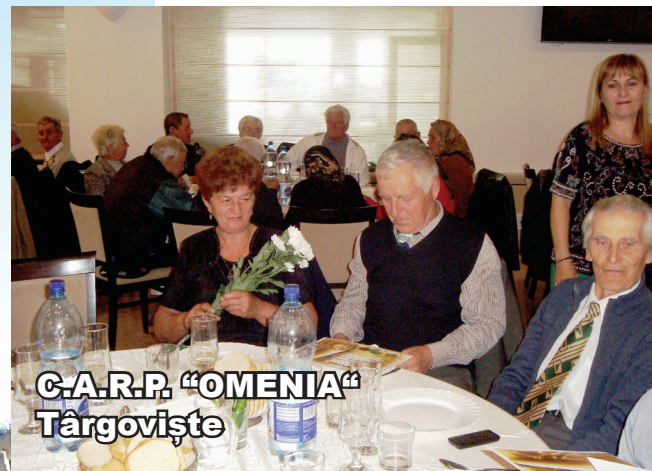
C.A.R.P. "OMENIA" Târgoviște