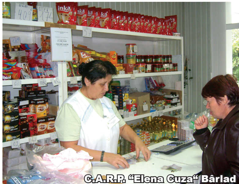
C.A.R.P. "Elena Cuza" Bârlad