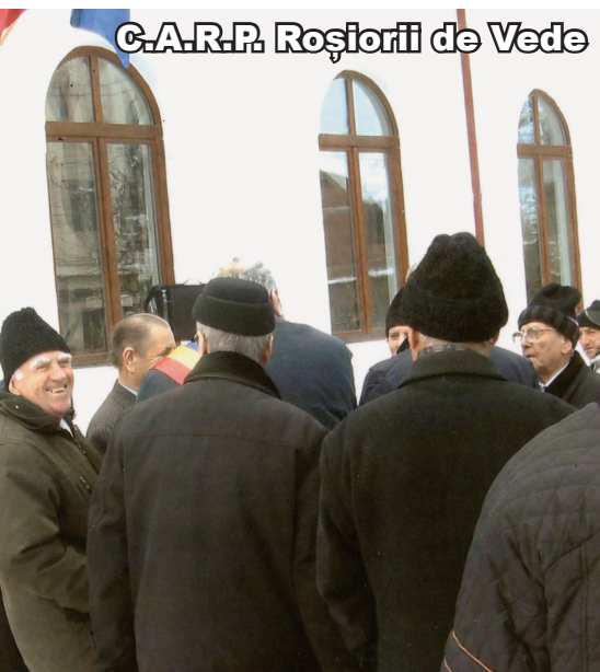
C.A.R.P. Roșiorii de Vede