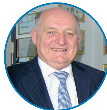
Excelența Sa Ambasadorul Belgiei la București, domnul THOMAS BAEKELAND

Solidaritatea dintre oameni te face mai puternic și o comunitate ca aceasta motivează contribuția voluntară. Ești mândru că lucrezi în acest sistem. Aceasta nu e regula generală în România încă, dar cu munca și exemplul dumneavoastră puteți să vă faceți cunoscuți altora. Puteți fi un exemplu pentru alte comunități.