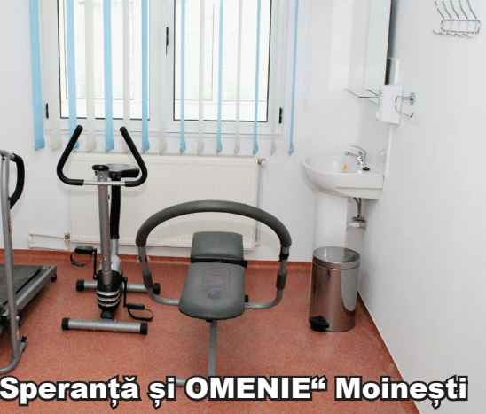
“Speranță și OMENIE” Moinești