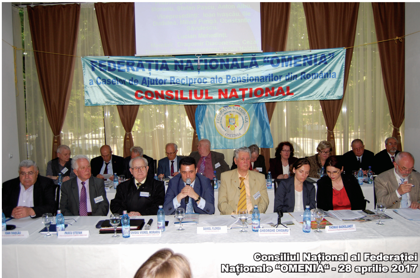
Consiliul Național al Federației Naționale "OMENIA" - 23 aprilie 2017