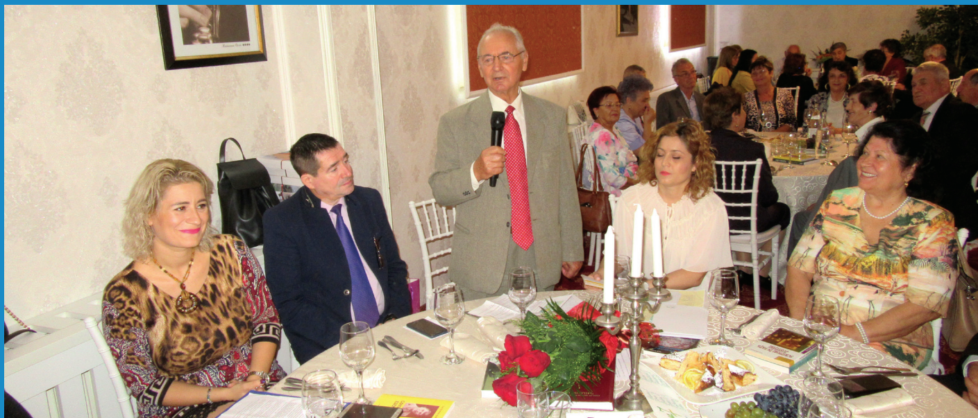
C.A.R.P. "Milcov" Focșani

Casele de Ajutor Reciproc ale Pensionarilor, membre ale Federației Naționale „OMENIA” reprezintă adevărate organizații de economie socială destinate seniorilor, cu o activitate bogată și susținută în sprijinirea drepturilor acestora la un trai decent și o bătrânețe liniștită. Pentru exemplificare, iată și câteva aspecte din viața acestor organizații.