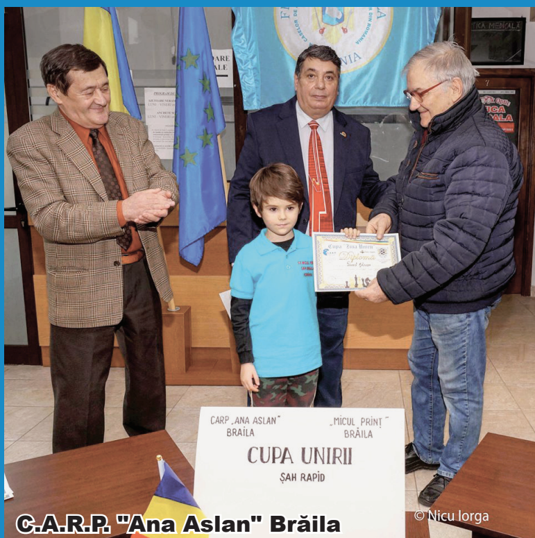
C.A.R.P. "Ana Aslan" Brăila