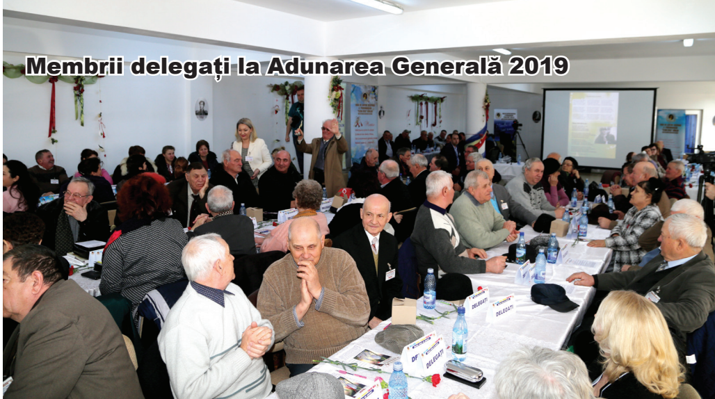
Membrii delegați la Adunarea Generală 2019

Tot cu gândul la bunăstarea și sănătatea membrilor, avem puse la dispoziție și cabinete de stomatologie, oftalmologie, tratamente, psihiatrie, medicină de familie, cabinet de ecografie și kinetoterapie. Numărul membrilor care au trecut pragul cabinetului oftalmologic a fost de 2.915 de persoane, în perioada 2010-2018, serviciile valorând 27.440 de lei. Pe lângă acest cabinet, Casa de Ajutor Reciproc a Pensionarilor colaborează cu o echipă de specialiști din Brașov, echipă ce vine de mai multe ori pe an la sediu pentru a oferi consultații oftalmologice