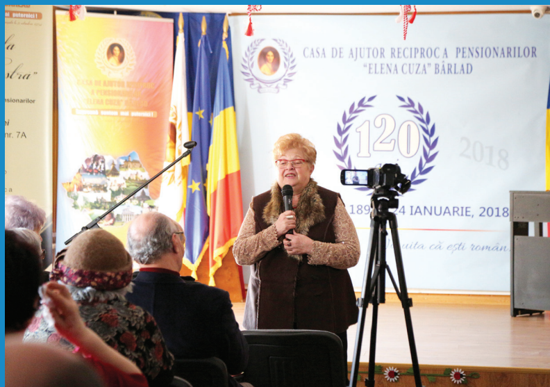
C.A.R.P. "Elena Cuza" BÂRLAD