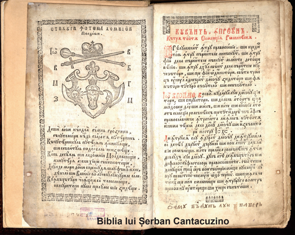
Biblia lui Șerban Cantacuzino