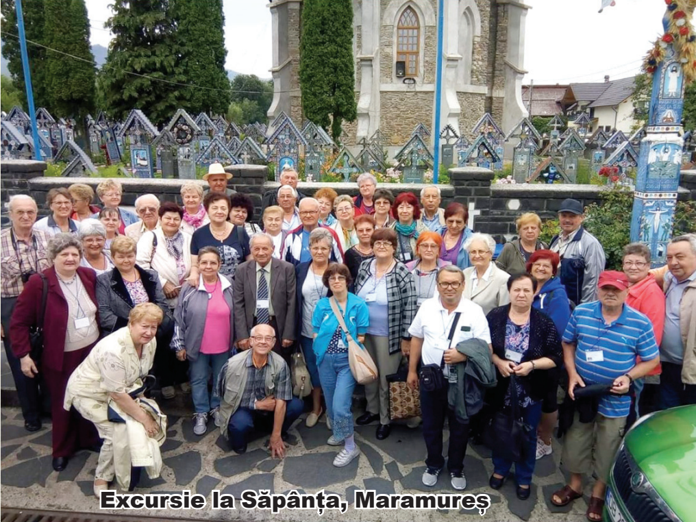
Excursie la Săpânța, Maramureș