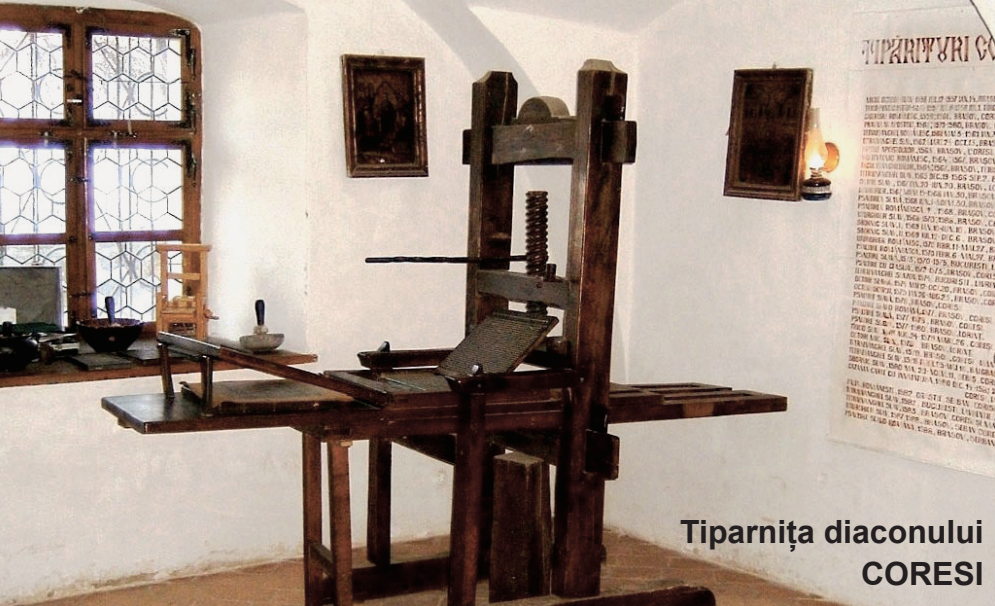
Tiparnița diaconului CORESI

mânească a unirii Moldovei cu Țara Românească sub domnia lui Alexandru Ioan Cuza, a publicat în Monitorul Oficial ordinul prin care alfabetul latin era introdus în administrație și învățământ. Sigur că toate aceste informații le puteați găsi singuri în cărți de istorie, dacă ar fi existat interes... Am vrut doar să amintesc cât mai pe scurt posibil câtă trudă, dorință și dăruire trebuia pentru ca noi, să beneficiem de o bogăție fără seamăn: Limba noastră!