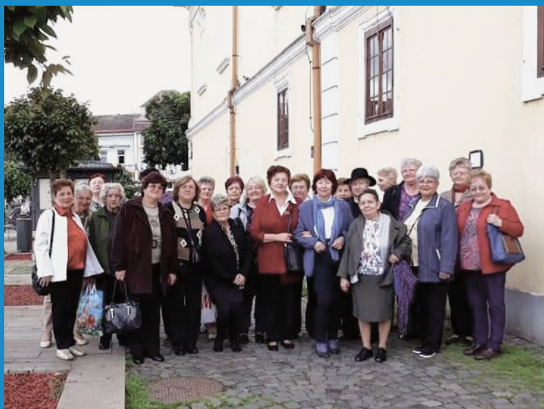
C.A.R.P. TÂRGU MUREȘ