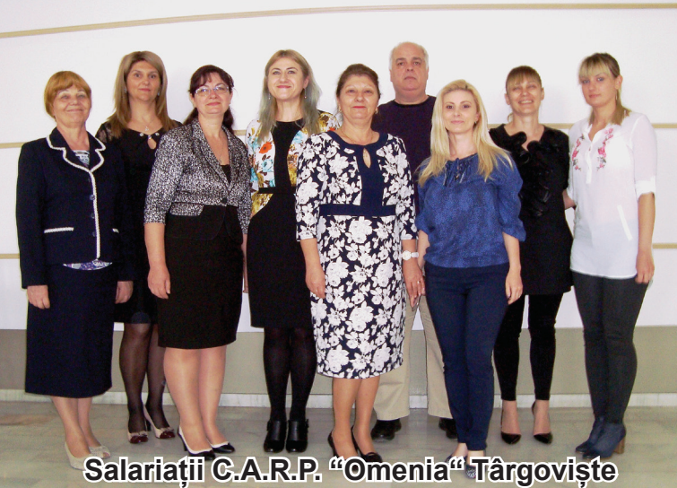
Salariații C.A.R.P. "Omenia" Târgoviște