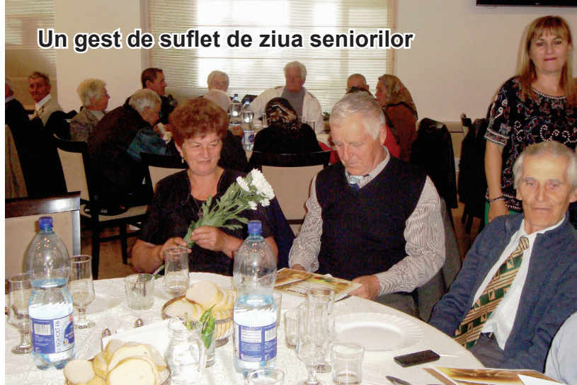
Un gest de suflet de ziua seniorilor

acordă consultații și efectuează și teste pentru depistarea osteoporozei. Tot în cadrul acestui cabinet avem o asistentă medicală care execută teste de glicemie, colesterol și trigliceride, acestea fiind, de asemenea, gratuite. Am achiziționat și un aparat ecograf cu care lucrează un medic primar internist. Pentru membrii C.A.R.P. ecografia costă 30 de lei, iar pentru nemembri, 35 de lei. Aceste sume se percep pentru consumabilele folosite la ecograf, medicii și asistentele fiind remunerați de către C.A.R.P.