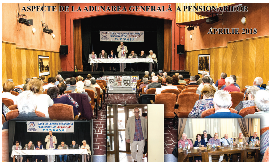
ASPECTE DE LA ADUNAREA GENERALĂ A PENSIONARILOR

Iată, în principal, care sunt direcțiile de acțiune ale asociației pe anul acesta: continuarea lucrărilor de reabilitare a clădirii din Aleea Ardealului nr. 26 cu destinația – REALIZAREA DE PROGRAME DE ASISTENȚĂ SOCIALĂ, MEDICALĂ, CULTURALĂ ȘI DE PROTECȚIE SOCIALĂ, procurarea de terenuri (spații) pentru sediile sucursalelor la prețuri avantajoase, menținerea unui număr minim de 18.000 de membri, organizarea de excursii pentru membrii asociației la tarife reduse cu 50% din contravaloarea transportului, perfecționarea activității de acordare a împrumuturilor, a ajutoarelor nerambursabile, diversificarea serviciilor socio-medice.