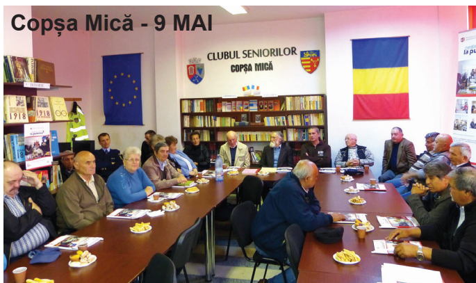
Copșa Mică - 9 MAI

nătate inerente vârstei a treia amplificate de lipsa serviciilor socio-medice, situații de discriminare întâlnite în cadrul unor interacțiuni cu autorități publice sau alți membri ai comunității, nerespectarea drepturilor acestora și „invizibilitatea” în societate.