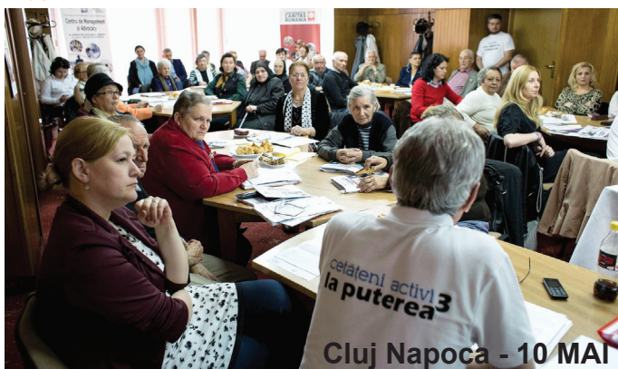
Cluj Napoca - 10 MAI