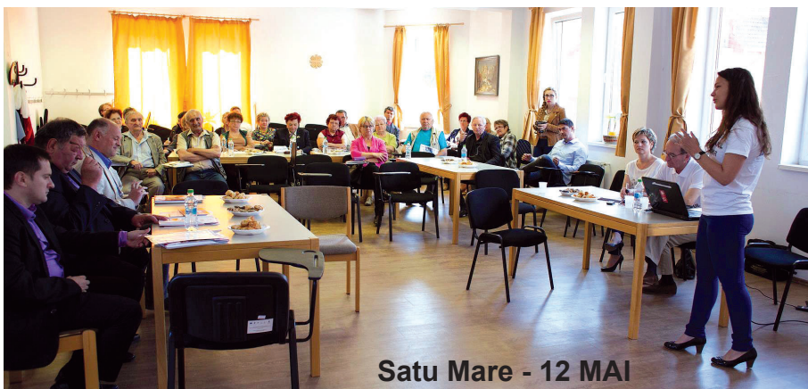
Satu Mare - 12 MAI

persoanelor vârstnice în managementul serviciilor publice, să îi consulte în deciziile publice pentru respectarea drepturilor și libertăților tuturor cetățenilor.