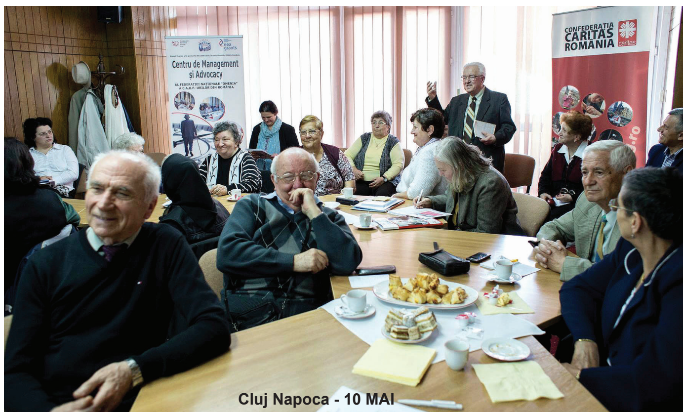
Cluj Napoca - 10 MAI

Concluziile desprinse în toate localitățile vizitate au avut ca numitor comun problemele socio-economice cauzate de veniturile insuficiente, situație în care se regăsesc peste 2 milioane de pensionari în țara noastră, problemele de să-