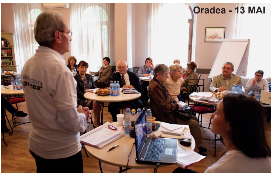
Oradea - 13 MAI

Mesajul seniorilor a fost ferm: este important ca autoritățile publice centrale și locale să includă nevoile și potențialul