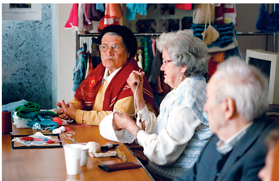
Centrul de Zi OMENIA, locul în care seniorii sunt încurajați să realizeze activități de îmbătrânire activă, sănătoasă și demnă

- Creșterea coerenței, în modul în care Uniunea respectă drepturile omului în propriile acțiuni, ale Statelor