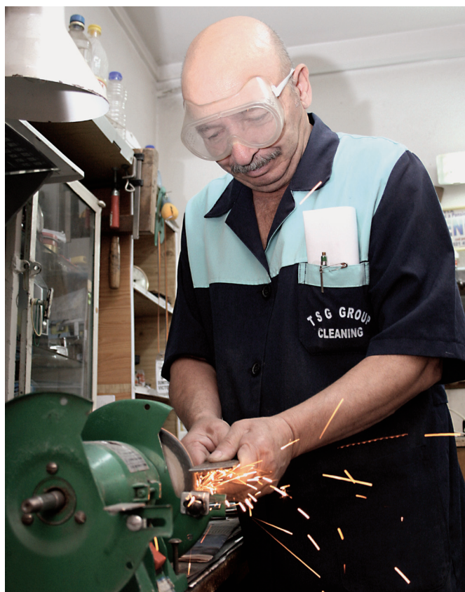
Asociația C.A.R.P. "OMENIA" oferă seniorilor posibilitatea de a lucra pentru o perioadă mai lungă cu facilități de formare și condiții de muncă adaptate lor, și de a se bucura de o viață demnă

- Reechilibrarea priorităților economice cu dimensiunea socială, în implementarea reformelor naționale, prin integrarea obiectivelor sociale din Europa 2020 în procesul Se-