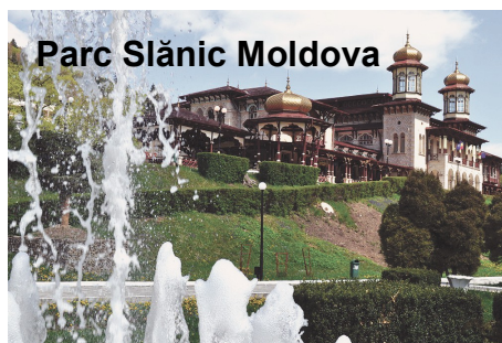
Parc Slănic Moldova

monument de patrimoniu construit în 1894 de către arhitectul George Sterian, cu valoare istorică, este Cazinoul. Cheile Slănicului se întind pe o lungime de aproximativ 400 de metri. Puteți descoperi un loc minunat la Cheile și Cascada Slănicului. Ajungând la o înălțime de aproximativ 20 de metri putem admira priveliștea deasupra cascadelor și cheilor. Printre plimbările noastre putem descoperi și Biserica Catolică construită în anul 1943, cea mai frumoasă biserică catolică din țară în stil avangardist. De asemenea, se poate vizita Mănăstirea Sfântul Ștefan cel Mare, fiind singura mănăstire închinată sfântului domnitor. Interiorul mănăstirii este repartizat între altar și naos, lateral adăugându-se un pridvor închis. Catapeteasma bisericii este din stejar sculptat. Slănic Moldova are și un Sanatoriu Balnear unde puteți găsi: instalații pentru terapie respiratorie (aerosoli și inhalații), băi calde în cadă cu apă minerală, electroterapie și hidroterapie, bazine pentru kineto-