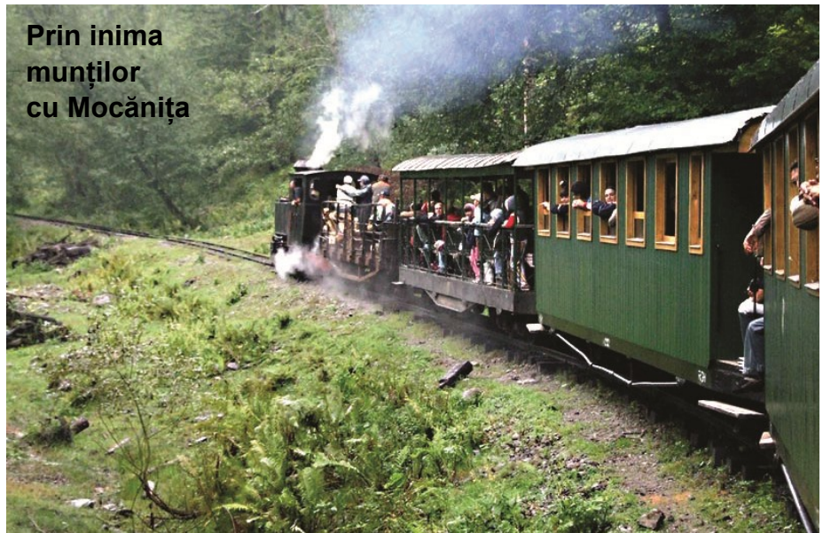
Prin inima munților cu Mocănița

A fost construită doar pentru transportul de lemne după Primul Război Mondial și este folosită și astăzi pentru a transporta turiștii. Linia a fost construită în anul 1933, oamenii din