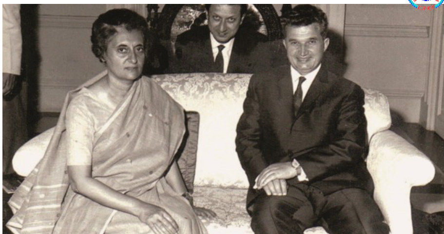
Nicolae Ceaușescu, președintele Consiliului de Stat al R.S.R., într-o vizită oficială în India. Vizită protocolară la Indira Gandhi din 13 octombrie 1969

Această perioadă de prosperitate îi aduce Indirei Gandhi câștigarea alegerilor naționale. În anul 1972, este acuzată de încălcarea legii alegerilor. În a-