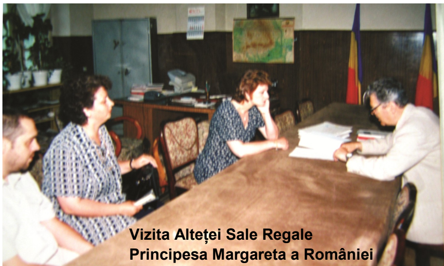
Vizita Alteței Sale Regale Principesa Margareta a României

Unii pensionari, veterani de război, sunt invitați în interiorul clădirii. Se scot scaune pentru cei care nu mai au loc înăuntru și nu mai pot sta în