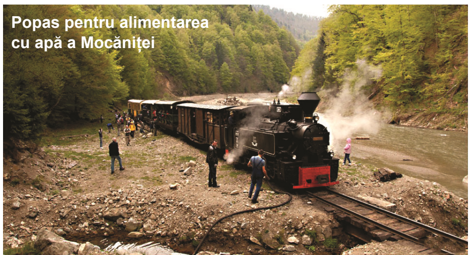
Popas pentru alimentarea cu apă a Mocăniței

Vișeu au de lucru pe această linie de mai multe generații, iar locomotiva cu aburi a reprezentat mijlocul lor de deplasare până la pădure și înapoi, acasă, pe timp de noapte.