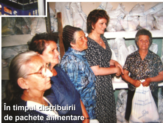
În timpul distribuiri de pachete alimentare

Articol preluat din Buletinul informativ trimestrial pentru vârsta a treia "Seniorii" Nr. 3/1999, editat