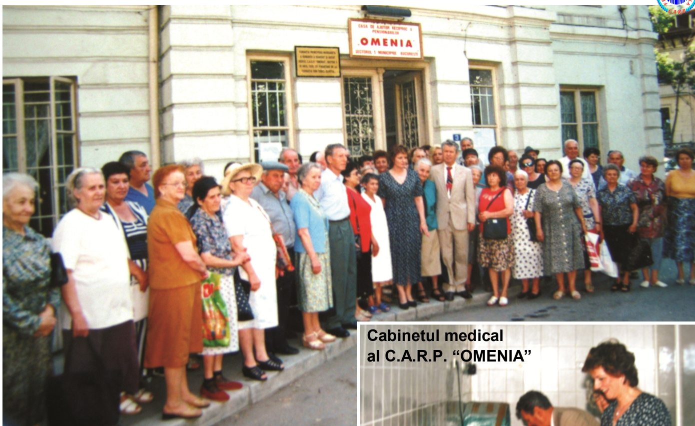
Cabinetul medical al C.A.R.P. "OMENIA"