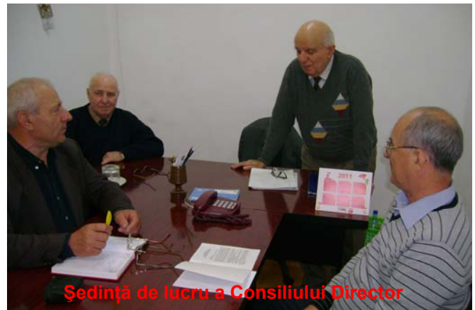
Sedință de lucru a Consiliului Director