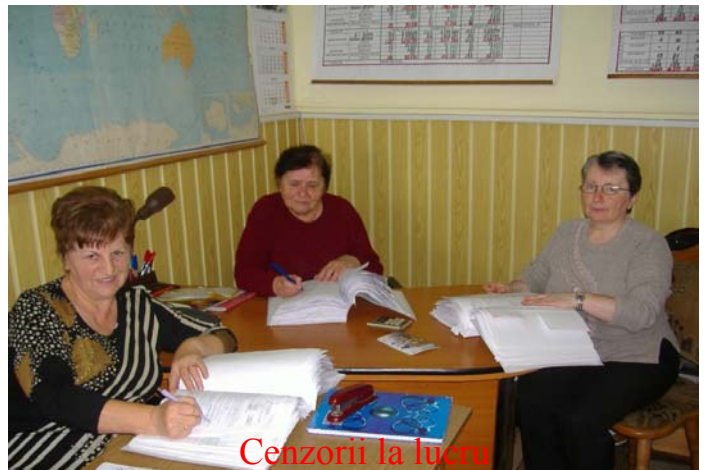
Cenzorii la lucru