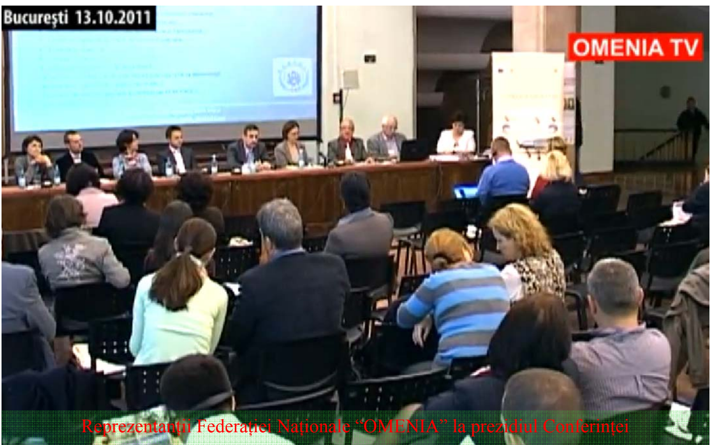
Reprezentanții Federației Naționale “OMENIA” la prezidiul Conferinței

Tot în cadrul lucrărilor conferinței s-a reliefat existența în România a unor adevărate rețele de economie socială, Federația Națională “OMENIA” a Caselor de Ajutor Reciproc ale Pensionarilor din România fiind cea mai mare ca număr de membri, peste