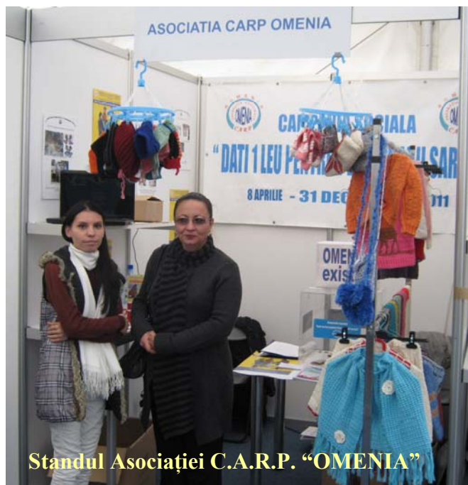
Standul Asociației C.A.R.P. "OMENIA"

De asemenea, participarea Federației a vizat și acțiuni de diseminare asupra aspectelor privind incluziunea socială pentru grupul defavorizat reprezentat de persoanele vârstnice.