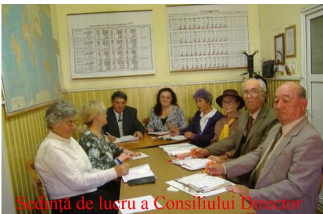
Sedință de lucru a Consiliului Director