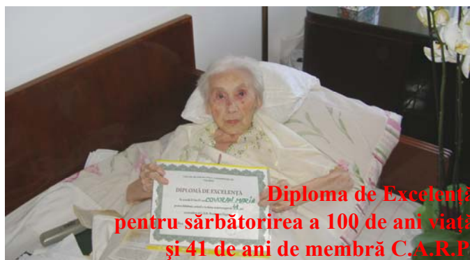
Diploma de Excelență pentru sărbătorirea a 100 de ani viață și 41 de ani de membră C.A.R.P.

• ajutoare nerambursabile ocazionale , în valoare de 100-170 lei, în funcție de pensie, situația socială și materială. Ajutoarele nerambursabile se acordă de cele mai multe ori cu ocazia sfintelor sărbători de Paște și Crăciun. De asemenea, cei care au vechime mare în C.A.R.P. și o vârstă înaintată (90 de