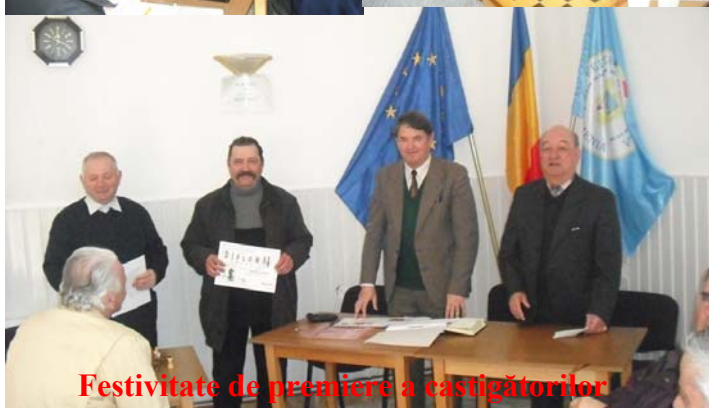
Festivitate de premiere a câștigătorilor

În acest club, pensionarii își petrec timpul liber în mod plăcut, în fiecare zi, în timpul programului de lucru al asociației.