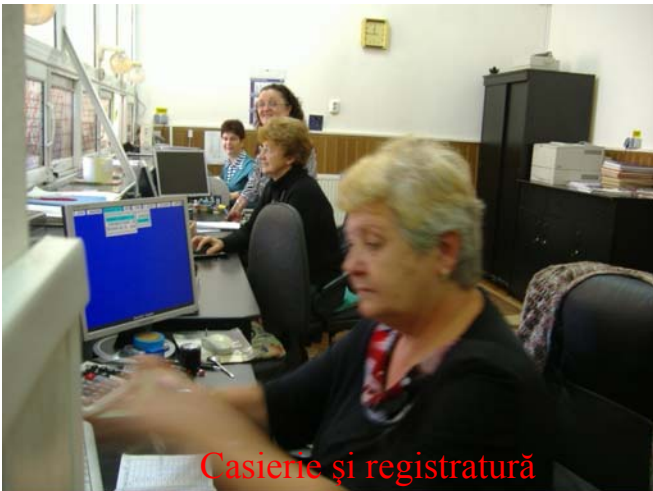
Casierie și registratură

Cu toate că se acordă un număr mare de împrumuturi, numărul restanțierilor este foarte mic (nu a depășit niciodată 5% din volumul împrumuturilor) datorită urmăririi cu consecvență a acestora (somații, popriri).